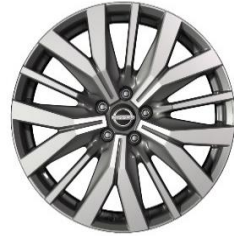
Lisävaruste Tekna 20" timanttileikatut kevytmetallivanteet