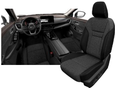
Acenta & N-Connecta Musta - tekstiili