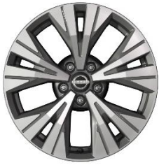
Acenta & N-Connecta 18" kevytmetallivanteet