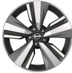
Tekna/lisävaruste N-Connecta 19" timanttileikatut kevytmetallivanteet