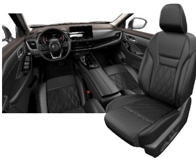
Tekna Musta - premiumnahkapenkit tikkauksilla