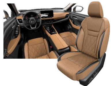
Lisävaruste Tekna(e-POWER- ja e-4ORCE-mallit) Ruskea - premiumnahkapenkit tikkauksilla