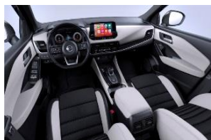
Lisävaruste Tekna Vaaleanharmaat kangas- ja keinonahkapenkit