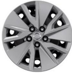
Visia 17" teräsvalteet(215/65 R17)