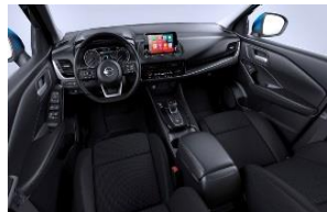
N-Connecta Harmaat kangaspenkit