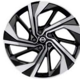
Lisävaruste Tekna+ 20" kevytmetallivanteet(235/45 R20)