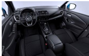
Visia & Acenta Mustat kangaspenkit