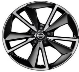
Tekna+Lisävaruste N-Connecta & Tekna 19" kevytmetallivanteet(235/50 R19)