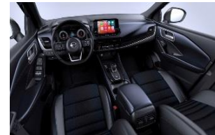
Tekna Sinimustat kangas- ja keinonahkapenkit