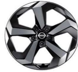
Acenta e-POWER, N-Connecta & Tekna 18" timanttileikatut kevytmetallivanteet