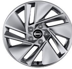
Acenta 17" kevytmetallivanteet(215/65 R17)