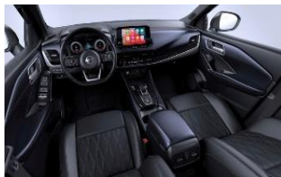
Tekna+ Sinimustat premiumnahkapenkit, päätuki keinonahkaa